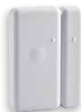
MDO BL TYXAL+