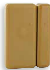
MDO BR TYXAL+