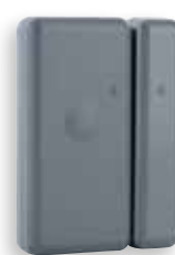
MDO GR TYXAL+