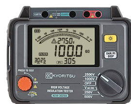
3025A 100GΩ 250V-2500V