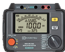
3125A 1TΩ 250V-5000V