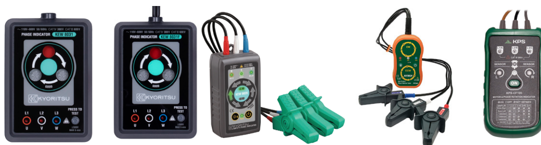
INDICATEURS DE PHASE

Les indicateurs de phase sont utilisés pour mesurer la séquence de phase et donc le sens de la rotation de moteurs électriques triphasés.